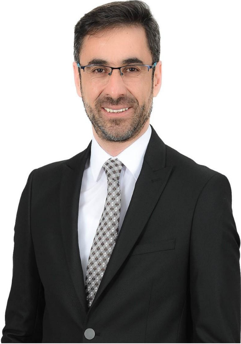
Nesrullah TANGLAY Bitlis Belediye Başkanı